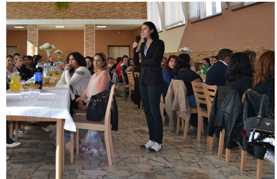
3 Spoločná úloha pre skupiny na celoslovenskom koordinačnom stretnutí, Križová Ves 2017